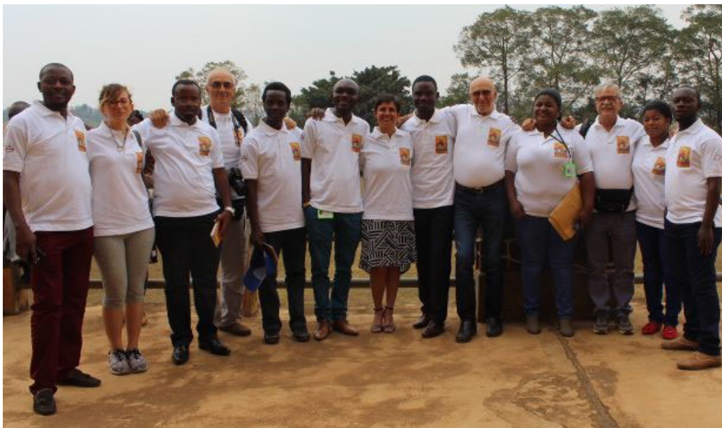
Volontari Colibrì e Volontari del Sad – Presentazione “Nel ventre di una donna” 26 luglio 2018, Bukavu (Repubblica Democratica del Congo)