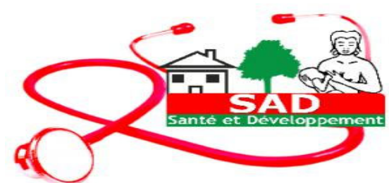
Donne e bambini accolte al S.A.D

Lo scorso luglio alcuni volontari Colibrì hanno fatto visita al centro logistico del SAD a Bukavu dove le donne vengono accolte, accudite e accompagnate in tutte le fasi riabilitative, dalle cure mediche e psicologiche che ricevono all' Hopital Sain Vincent di Bukavu, fino al reinserimento nella società. In quella occasione abbiamo consegnato loro indumenti e piccoli oggetti che le volontarie del nostro mercatino etico avevano preparato per loro.