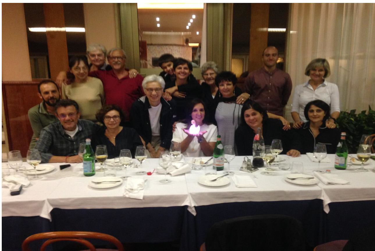
Volontari attivi 2018 Associazione "Colibrì"

E' importante sottolineare che il mercatino etico diventa ogni anno che passa un luogo dove, non solo si possono fare acquisti vantaggiosi a prezzi convenienti, ma anche un ambiente multietnico dove è possibile entrare in contatto con persone di diversa provenienza e proprio per questo un'opportunità per arricchirsi della diversità dell'altro instaurando nuove relazioni.