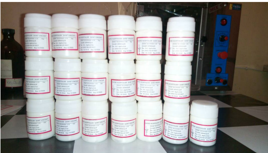
Preparazione galenica: DICLOFENAC 1 % CREMA - Laboratorio Galenico Hospital Saint Vincent (RDC)